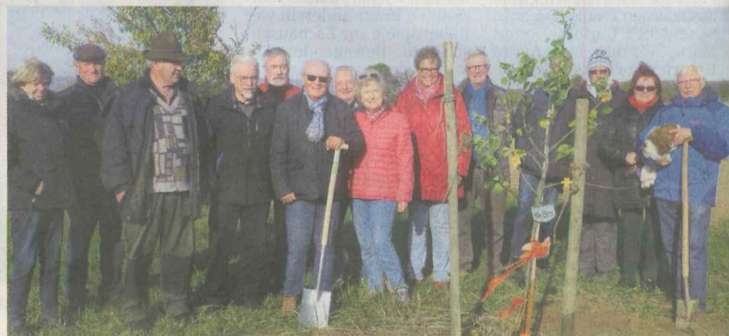
„Kleebirne“ im Birnensortengarten Breckenheim gepflanzt.