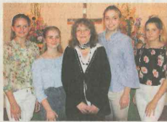
Nacht der Kirchen mit vier jungen Orgelspielerinnen.