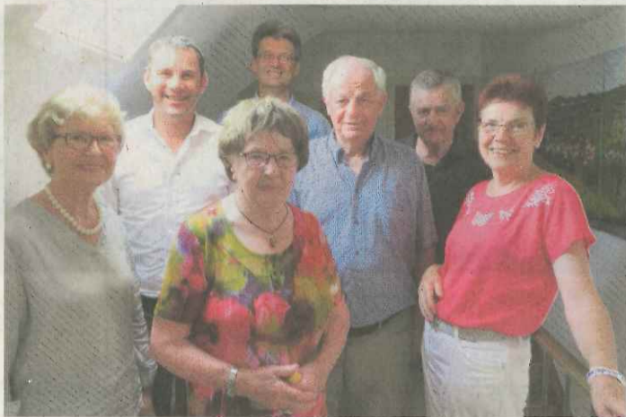
Hoher Besuch im Dorfmuseum.