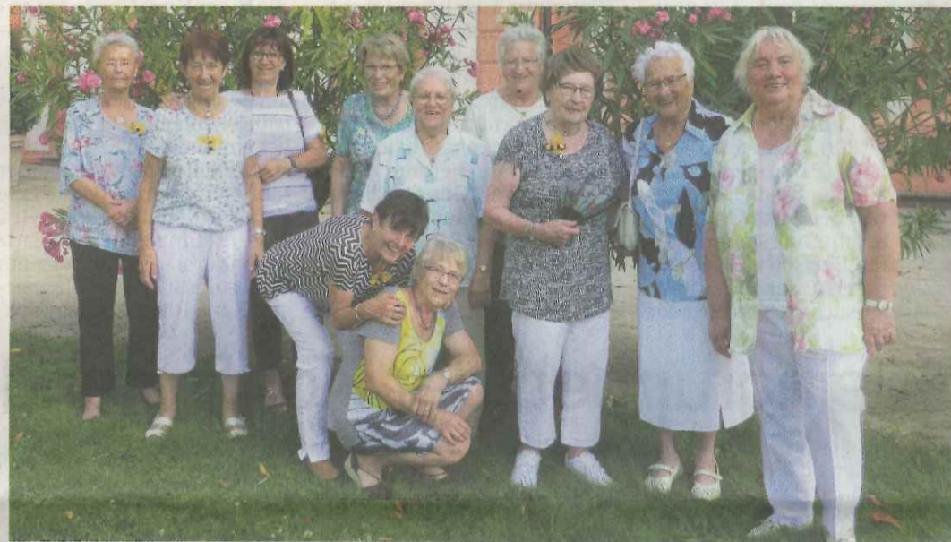
Jubiläumsfeier zum 70-jährigen Bestehen der Bezirkslandfrauen. Die Breckenheimer Landfrauen waren dabei.