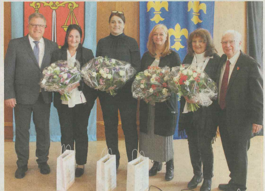
Die Empfänger des Gerichtssiegels (mit Blumensträußen).

Bildrückblick 2018 aus Breckenheim auf den Folgeseiten