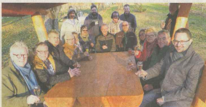
Scheuerlinger Winzer e.V. haben Bänke fertiggestellt.