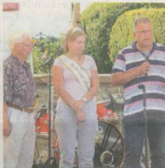
Dorfplatzfest ersetzt die Breckenheimer Kerb.