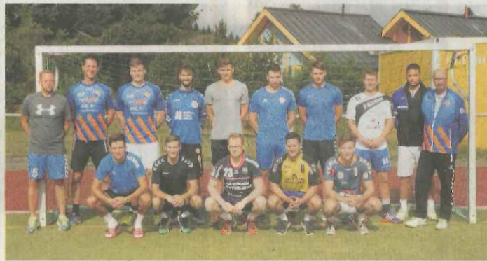
Breckenheims „Bobfahrer“ im Trainingslager Oberhof.